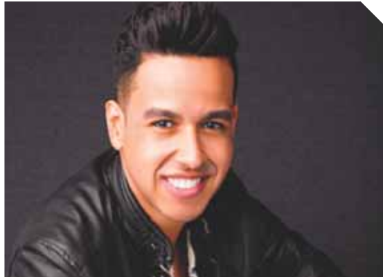
El trabajo discográfico, titulado Sin límites y respaldado por Sony Music, llegará al mercado el último día de este mes.

► Isabella Calderón | redaccion@versionfinal.com.ve