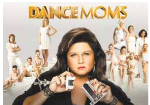
Abby Lee junto al Grupo Elite y sus Dance Moms.