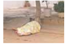
La víctima quedó tendida en el pavimento.

La víctima recibió al menos siete impactos de bala, en la calle B del referido sector. El cuerpo quedó tendido en la vía con la cabeza destrozada, justamente frente a su casa, que se encuentra al lado de un Mercal. Funcionarios de la PNB hallaron el cadáver y