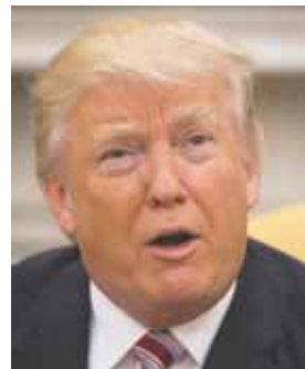
Trump manifestó que Comey "no hacía un buen trabajo".

Por su parte, la canciller venezolana, Delcy Rodríguez, celebró el resultado. "Fueron derrotados nuevamente los países injerencistas que en la OEA pretendieron atentar contra la soberanía de Venezuela, mediante acción ilegal contra el reglamento interno". "Quisieron modificar el reglamento de reunión de Cancilleres para manipular el número de votos a favor de la intervención de Venezuela, y salieron derrotados", escribió en s @DrodriguezVen.