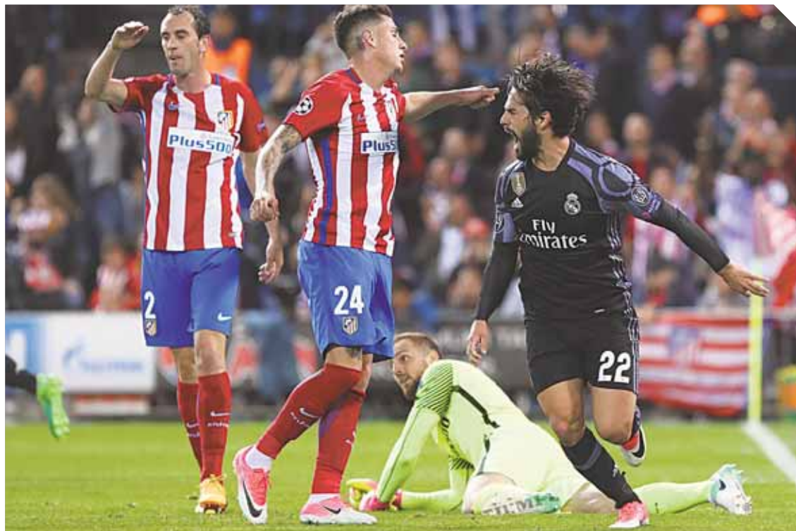
Real Madrid superó el obstáculo del Atlético y definirá la Champions con la "Juve".