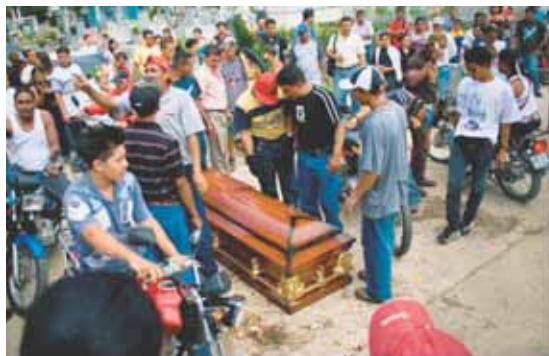
Los sepelios de delincuentes convierten los camposantos en bombas de tiempo.

gro!” exclama mientras mira al cielo y deja salir una solitaria lágrima.