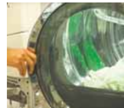
Las secadoras convencionales consumen mucha energía.