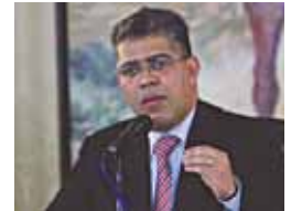
Ministro de Educación, Elías Jaua.