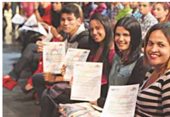
Los estudiantes agradecieron a la Gobernación por el aporte.