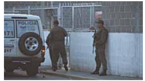
El retén de Colón también está sobrepoblado.