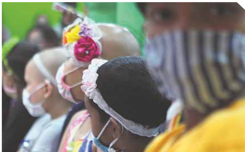
Algunos niños fueron dados de alta en tanto se reparan los aires acondicionados, sin servicio desde hace un mes.