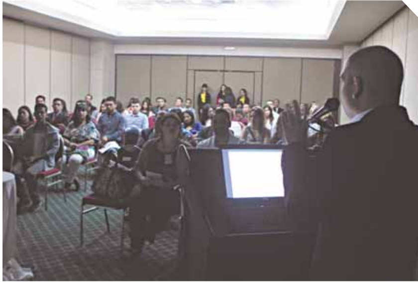
Las exposiciones se desarrollaron en los salones América y Europa del Hotel Crowne Plaza Maruma.

La actividad se realiza cada dos años. Participan 2.500 expositores nacionales e internacionales, especialistas en temas de salud