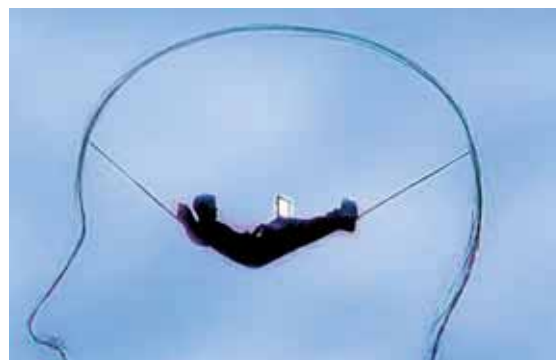
El ciberespacio puede afectar nuestra forma de pensar y comportarnos.

nectarse al ciberespacio es alejarse de la realidad, creando distracción y retrasos en las actividades cotidianas