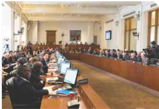
El Consejo aprobó el nombramiento del magistrado colombiano Luis Vargas Silva, para ser el nuevo integrante de la Comisión Interamericana de Derechos Humanos.

El Consejo Permanente de la Organización de Estados Americanos (OEA) debió postergar al lunes la definición de una fecha para una reunión de cancilleres dedicada a Venezuela, al no lograr acuerdo sobre una propuesta para el 22 de mayo.