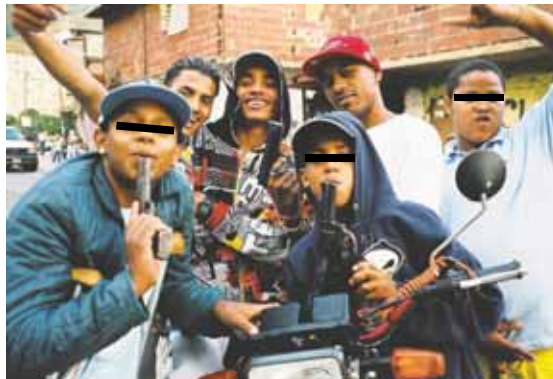
La delincuencia crece en Venezuela, según criminólogos.