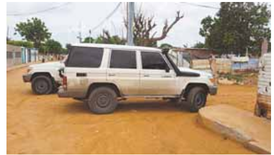
Las unidades policiales custodian el lugar del hecho.

A pesar de habersele practicado la cirugía, Édgar falleció.