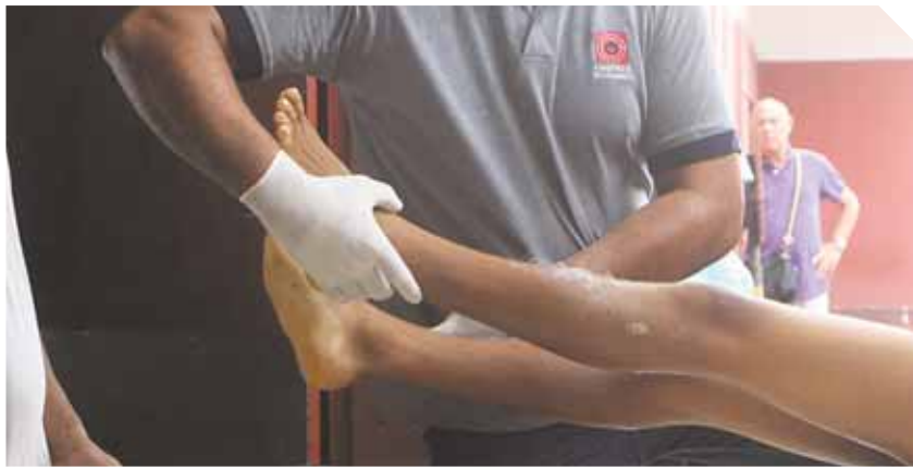
A la morgue de la Universidad del Zulia fue ingresado el cuerpo del muchacho, que cayó al vacío en el centro educativo.

El adolescente, de 14 años, huía del profesor para no asistir a la clase y subió a la segunda planta, cuando resbaló y cayó al vacío. Murió en el HUM