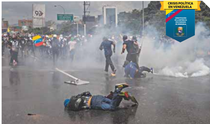
Los manifestantes fueron reprimidos con lacrimógenas, perdigones y agua a propulsión en la Fajardo, a la altura de Bello Monte.