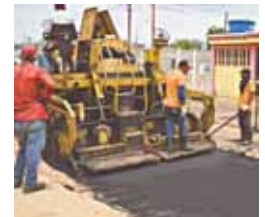
Reasfaltado de la avenida 49-G se inició este miércoles.