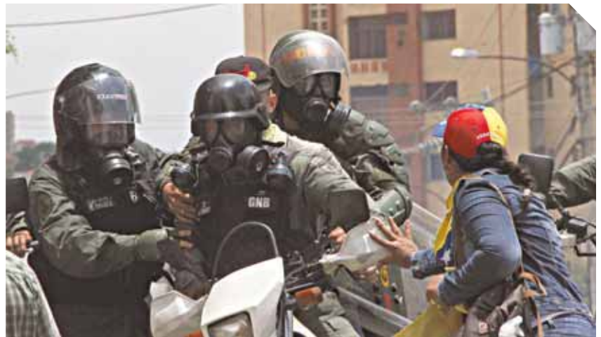
Amnistía Internacional: Cerca de 250 civiles del Zulia, Carabobo y Falcón, fueron pasados a las órdenes de tribunales militares.

La solicitud de la Fiscal 41 del Zulia, según nota de prensa, se hizo con fundamento en los artículos 261 y 49, numeral 4, de la Constitución de la República Bolivariana de Venezuela, referidos a que las personas deben ser juzgadas por sus jueces naturales. Además del artículo 76 del Código Orgánico Procesal Penal, que contempla la unidad del proceso, es decir, que por un solo delito o falta no se seguirán di-