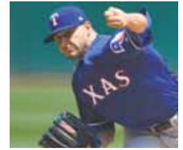
Martín Pérez va a su décima presentación ante un abridor venezolano.