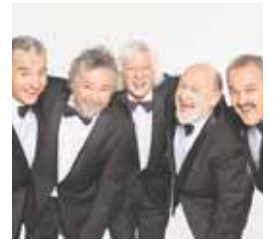
Integrantes del grupo Les Luthiers.

Les Luthiers, un grupo de músicos y humoristas argentinos conformado por Marcos Mundstock, Carlos Núñez, Carlos López, Jorge Maronna, Horacio Turano y Martín O'Connor, quienes se caracterizan por el uso de instrumentos musicales de su creación, fueron galardonados este miércoles en Oviedo con el Premio Princesa de Asturias de Comunicación y Humanidades 2017.