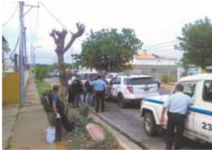
Funcionarios permanecían frente a las instalaciones del retén situado en Cabimas.