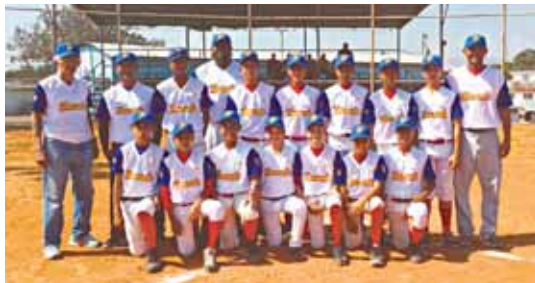
El equipo intermedia cumplirá el sueño de representar al país.

También explicó que está vez se destinará el apoyo económico a la intermedia, porque es la primera delegación del año en competir a nivel internacional y además, porque será la primera vez que Venezuela participe en la competición dicha categoría.