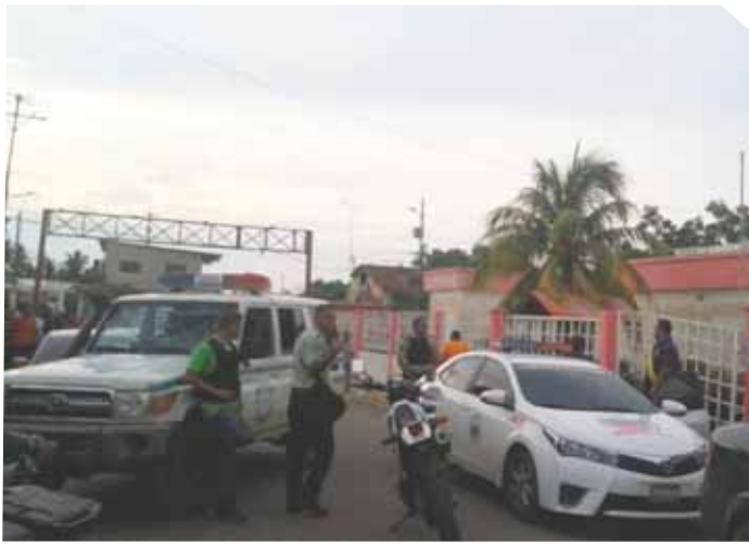
Las patrullas bloquearon el área de enfrentamiento por más de una hora.

Los hampones, al ver a los uniformados, mostraron una actitud agresiva, intentaron escapar pero al sentirse acorralados, Keving Howard Torrealba Silva, de 24 años, y su compinche, alias "El Gago", desenfundaron sus armas de fuego y co-