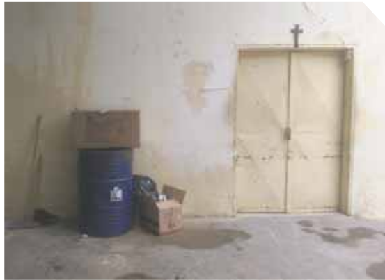
Cajas con miembros amputados desprenden sangre, a solo unos metros de la cocina del Hospital General del Sur.

► Paola Cordero | pcordero@versionfinal.com.ve