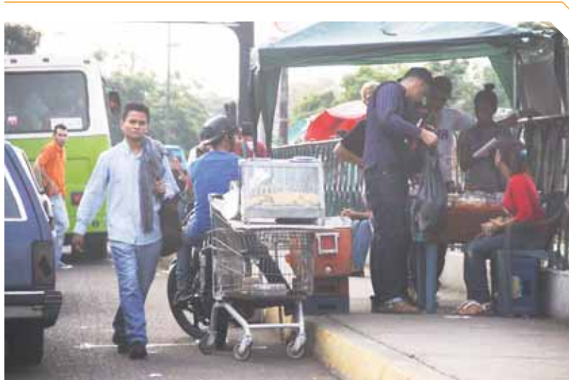
Las aceras son usadas como comercios improvisados, mientras los peatones arriesgan sus vidas al caminar por la carretera.

Las personas que caminan frente al centro comercial Galerías Mall tienen que hacerlo por la carretera, ya que los buhoneros de la zona se han apropiado de las aceras para colocar sus mesas de trabajo. Los transeúntes se quejan continuamente de los peligros a los que se exponen al tener que caminar por la avenida La Limpia, mientras los carros circulan por la vía. Los afectados piden a las autoridades retirar a estas personas de las aceras y reubicarlas en sitios donde no obstruyan el paso peatonal, porque en cualquier momento puede ocurrir un accidente que cobre la vida de un inocente.