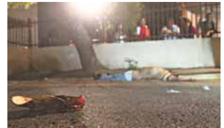
La gorra de la víctima quedó a unos metros.