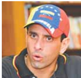
Gobernador del estado Miranda, Henrique Capriles.