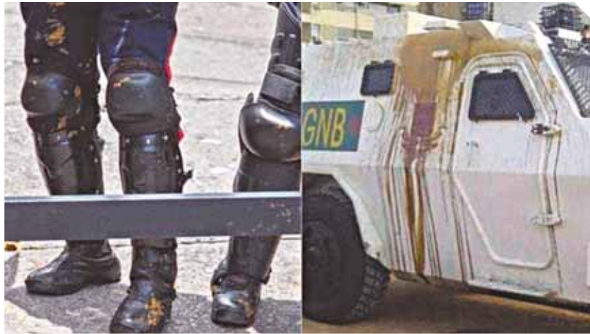
“Ellos con gas, nosotros con excrementos”, reza ahora el lema de las marcha opositoras.

► Javier Sánchez | jsanchez@versionfinal.com.ve