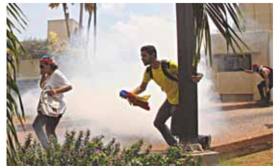
Cruz Verde registró 6 heridos por impacto de bombas lacrimógenas.