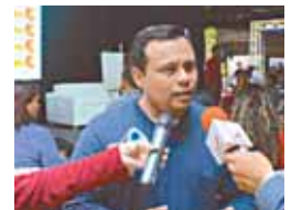
Presidente de Conatel, Andrés Eloy Méndez.