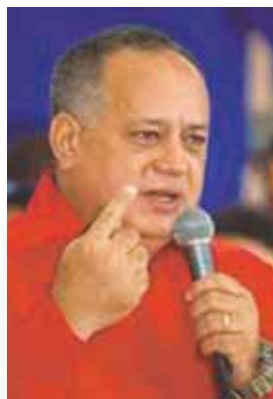
Primer vicepresidente del PSUV, Diosdado Cabello.