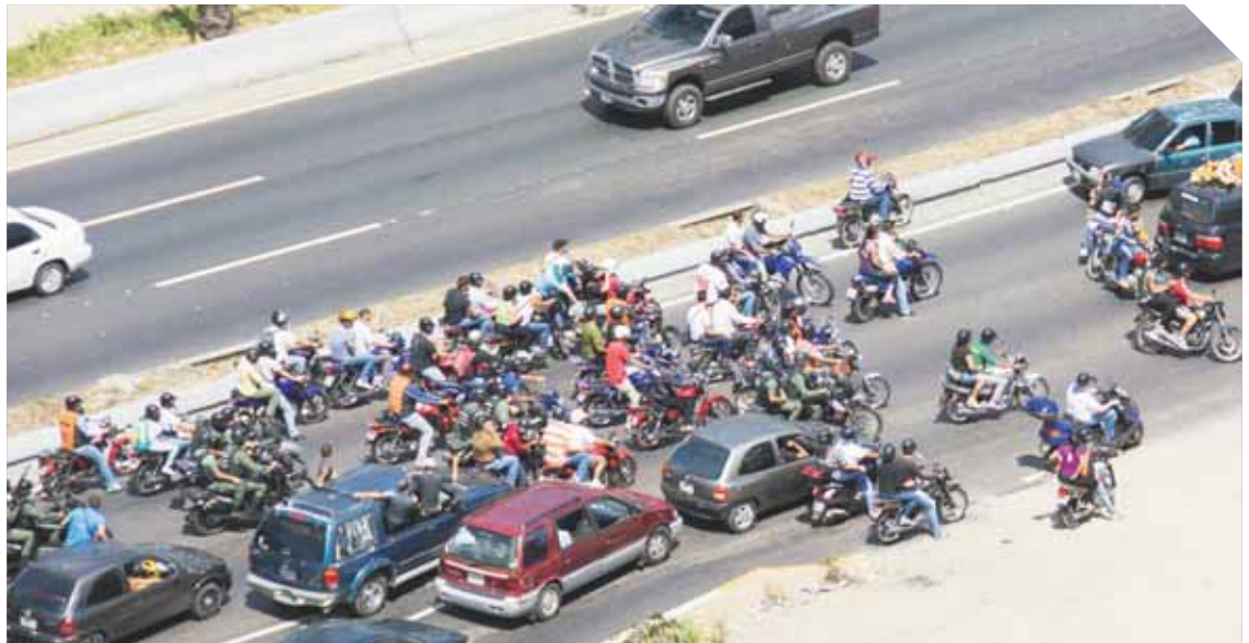
La muerte de delincuentes vinculados con organizaciones socialistas genera distorsiones. En algunos casos, efectivos de la GNB custodian las caravanas fúnebres.