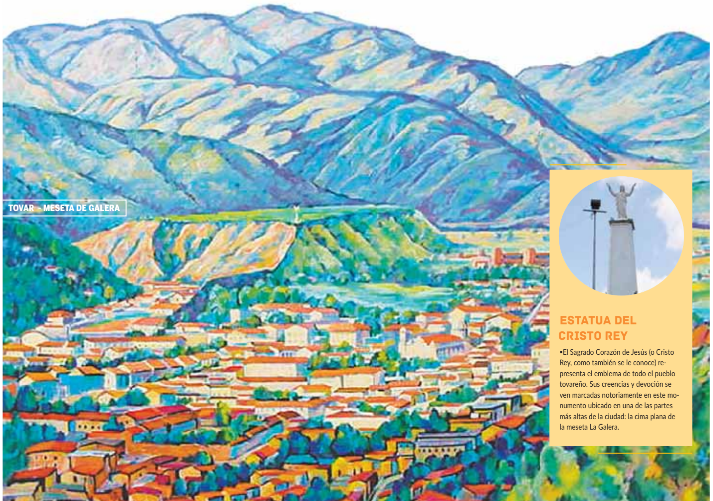
TOVAR - MESETA DE GALERA

Sin dudas, este estado andino guarda en sus espacios una diversidad natural marcada e importante para la región; maravilloso en su totalidad, Mérida, Tovar y la meseta se convierten en lugares para gozar de la flora y la fauna. Sus verdes áreas, fresco clima y singular belleza paisajística hacen de la meseta La Galera un destino maravilloso para todos los turistas.