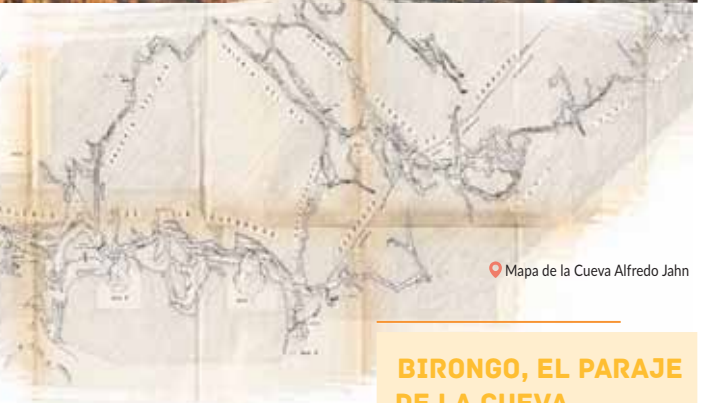
Mapa de la Cueva Alfredo Jahn

Mientras que afuera, una vegetación de bosque verdea y protege el monumento natural, aunque, en una época del año, el verde pasa de temporada y el