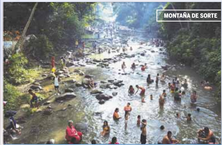
MONTAÑA DE SORTE

Los indios jirajara y niva se establecieron en Nirgua, Cocorote y San Felipe; los caquetíos, en Guama, Iboa, Chivacoa y Yaritagua; los noaras también estaban en estas zonas.